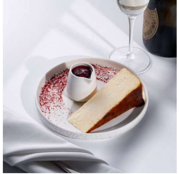
ბასკური ჩიზქეიქი (წ) 32 ლ/GEL თქვენ არჩევით: შოკოლადის ან კენკრის სოუსით

Thin layers of flaky puff pastry filled with crème pâtissière and raspberry coulis, dusted with powdered sugar, and silky vanilla custard sauce