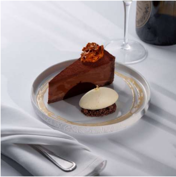
შოკოლადის ტარტი (თ) 32 ლ/GEL ფხვიერი ტარტი შავი შოკოლადის შიგთავსით, რძიანი შოკოლადის განაში, მორთმეული შოკოლადის ქრამბლით და ვანილის მუსი ფორთოხლით