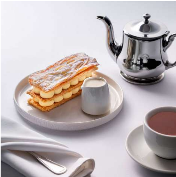
ვანილის და ჟოლოს მილფუეი 28 ლ/GEL ფენოვანი ფირფიტები, მოხარული კრემი, ჟოლოს პიურე, შაქრის პუდრა და ვანილის სოუსი

Filled with dark chocolate and salted caramel, dusted with icing sugar. Served with vanilla ice cream and crunchy nut crumble