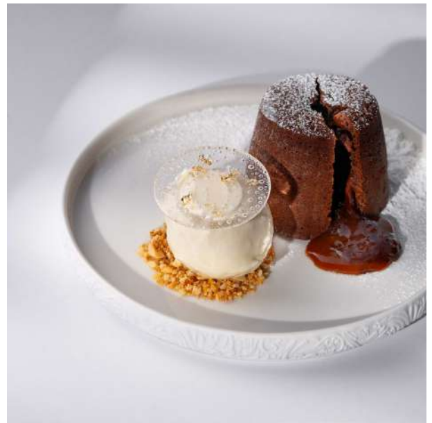
მდნარი შოკოლადის ლავა ქეიქი 30 ლ/GEL შავი შოკოლადი, მარილიანი კარამელი და შაქრის პუდრა, მორთმეული ვანილის ნაყინით და ხრაშუნა თხილის ქრამბლით

Crisp sweet pastry case, soft dark chocolate filling, and silky milk chocolate ganache, served with chocolate soil and orange-vanilla mousse